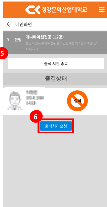
<출석체크 종료 화면>