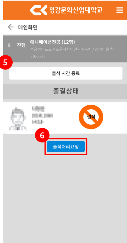
<출석체크 종료 화면>