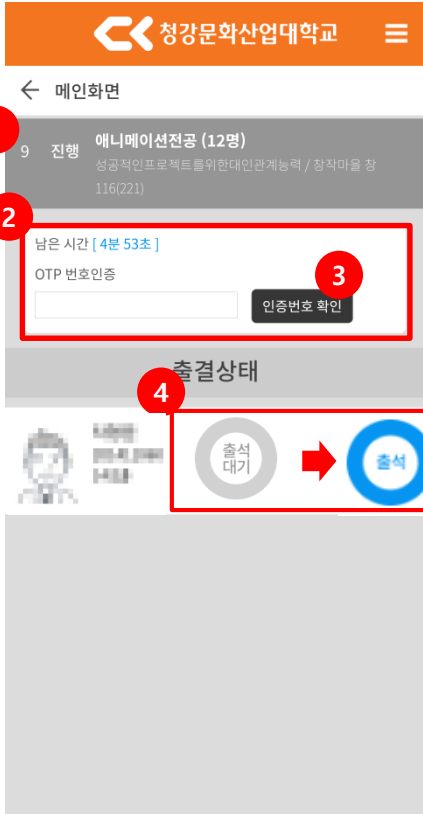
<출석체크 진행 시>