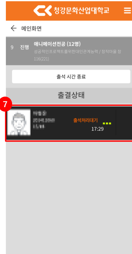
<출석처리 요청 화면>