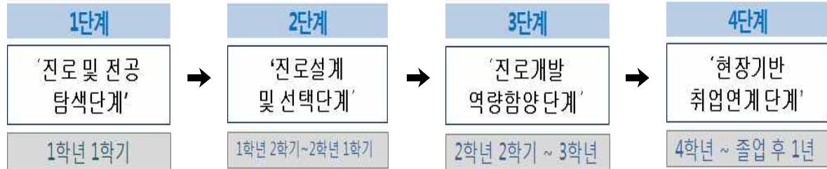
<학기별 진로취업지도 목표(예시)>

1학년 1학기는 초기 전공 및 직업탐색시기로 ' 진로 및 전공 탐색단계 ', 1학년 2학기~2학년 1학기는 개인별로 구체적인 진로계획을 수립하여 탐색하고 역량을 개발하기 시작하는 ' 진로설계 및 선택단계 ', 2학년 2학기~ 3학년은 수립한 진로계획에 따라 요구되는 역량을 개발하며 필요한 교과 및 비교과 이수 등에 시간과 노력을 집중적으로 투자하는 ' 진로개발 역량함양단계 ', 4학년 및 졸업 후 1년까지는 청년취업인턴제, 취업성공패키지 참여 등 취업연계프로그램의 운영을 통한 사회진출 지원을 적극 추진하는 ' 현장기반 취업연계단계 '로 구성하였다.