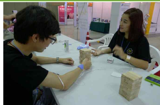
손떨림(강직) 장애 체험존