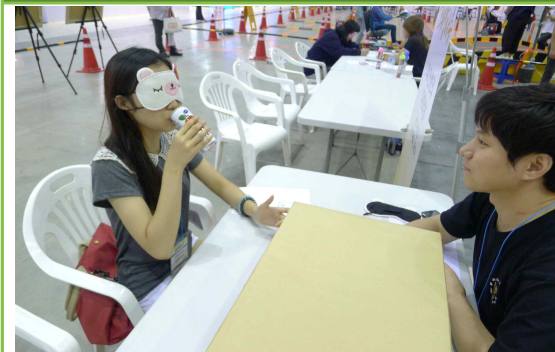
시각장애 체험 - 음료수 알아맞추기