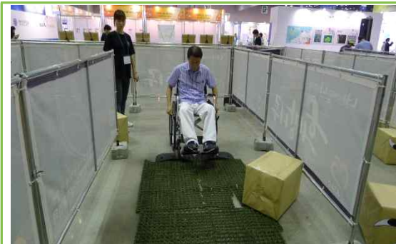
휠체어 체험 지체장애존