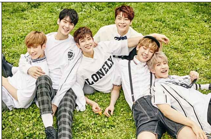
아스트로 (2일차: 11월16일, 수)