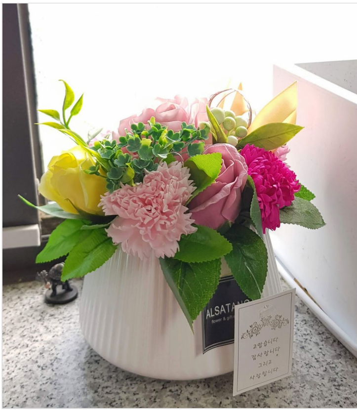
사랑과 행복이 풍성한 크리스마스 되세요 ^^