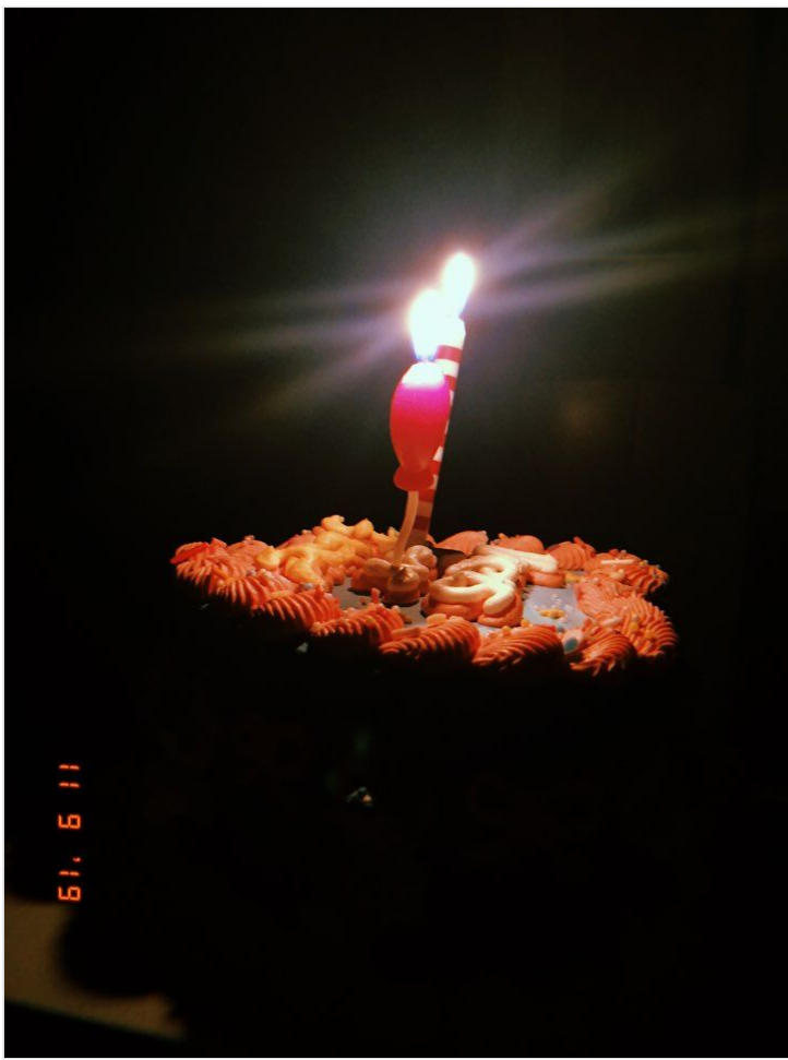
청강대의 모든 이들에게 함께 빛나자 청강의 별들이여